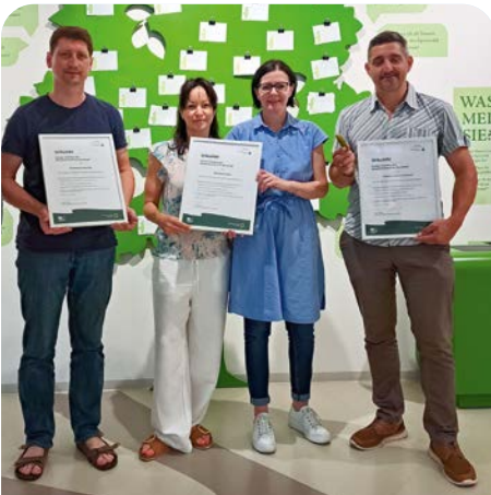
Auszeichnung der neuen Partner im Bereich Be- herbergungs- betriebe

Im Rahmen der Partner-Initiative gehen das Biosphärenreservat und im Spreewald tätige touristische Unternehmen eine vertraglich geregelte Kooperation ein. Die Partner-Initiative richtet sich an Unternehmen mit einem direkten geographischen oder wirtschaftlichen Bezug zum Biosphärenreservat Spreewald. Den Schwerpunkt legen wir gegenwärtig auf die Bereiche: Kanuverleiher, Umweltbildungseinrichtungen, Gastronomiebetriebe,