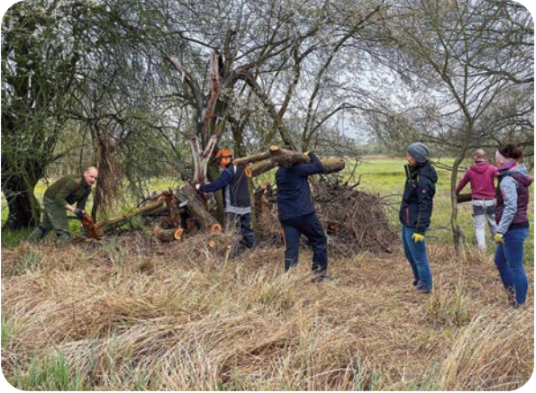
Landschaftspflegeeinsatz – Beseitigung von Bruchholz in der Streuobstsiedlung am Barzlin