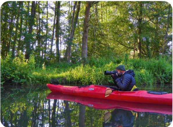
Während seiner Foto-Exkursionen überrascht Martin Siering mit einzigartigen Fotoperspektiven und sensi- bilisiert die Teilnehmenden im Umgang mit der Natur.