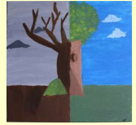
Amely Florich „Leben“