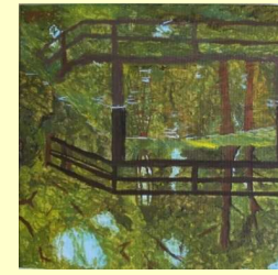
Paul Rahn „Brigde to nowhere“